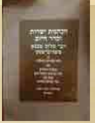
הנהגות ישירות וסדר היום מראהבישט שנדפס מחדש בברוקלין שנת תשמ"א

הנהגות ישירות וסדר היום לרבי שלום לפי סדר נכון וחדש עם תוספת ציונים הערות וביאורים והרחבות מספריתלמידי הבעש"ט הקדוש וצאצאי בית רוזי"ן כפי שנערכו על ידי מכון 'שכינת שלום' ללימוד ולפרסום תורת וסגולת הרה"ק הרבי ר' שלום מפראהבישט זיע"א