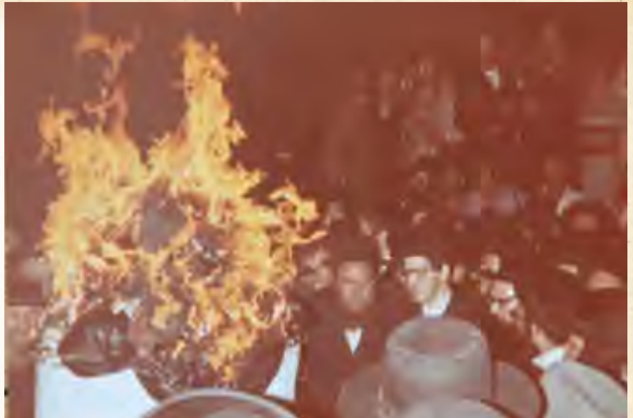
מירון תשל"ז - כ"ק אדמו"ר מבאיאן שליט"א ברגע ההדלקה

אלא שאיטעא מילתא ומאת ה' היתה זאת, שכ"ק אדמו"ר מבאיאן-ניו-יורק זי"ע עלה לארץ ישראל בשנה זו והיה אמור לשהות בל"ג בעומר במירון בכדי להמשיך