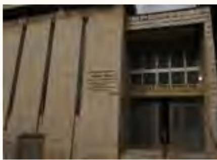
שם ושאריה, הבנין ברחוב חנה 2 ירושלים שהוקם והוקדש לשמו של האדמו"ר רבי ישראל מאלעסק-בארלדא על ידי בתו והוקדש לשיבת טשעביץ כיום משמש בימ"ד לחסידי פשעוורסק