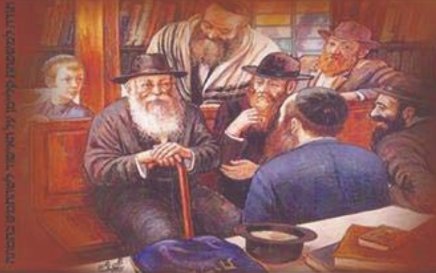
תורה למסעות קייטן על האשיר ליהודים במבוא