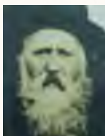
תמונה נוספת מהרה"צ רבי ישראל מאלעסק-בארלדא בתקופת כהונתו באדמו"ר"ת בבארלדא שברומניה