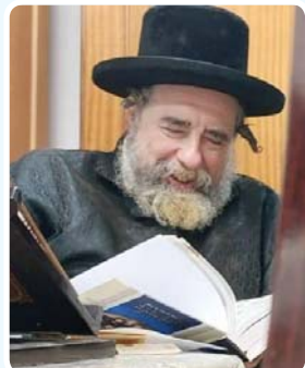
כ"ק מרן הרבי מרחמסטריווקא שליט"א מעיין בספר החדש מתיקות הדף היומי

מורי ורבותי, תצילו את הדורות הבאים, אני שומע שיש מקומות בעולם שנותנים פיצה או סעודה חלבית בברית. לצערנו יש בעולם מכת נשירה, ואם אפשר על ידי "פיש און פלייש" [דגים ובשר] להציל נשמות ישראל, האם נחשוב על כסף?... יעזור השי"ת שנזכה כולנו לאידישע ערליכע דורות, דורות ישרים מבורכים, ושנזכה להסיר את ערלת הלב, להתקרב לבורא עולם לעשות נחת רוח לבורא יתברך שמו אמן.