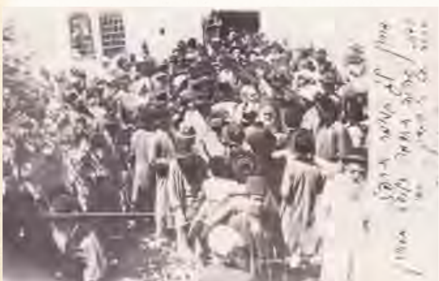
מירון תרפ"ו - הרה"ק מבאיאן טשערנוביץ בל"ג בעומר במירון, בצאתו מהיכל מערת הרשב"י מהצד של קבר רבי אלעזר

בין בתרי המכתבים הנדירים המאשרים את חזקת ההדלקה בידי אדמו"ר ר' ווי"ן-באיאן, מצוי "אישור מרבני הספרדים בצפת" על קבלת התרומה לכבוד