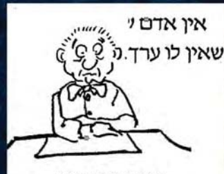
אין אדם י שאין לו ערך.

במקרה הגרוע ביותר, תוכל לשמש כדוגמה שלילית!