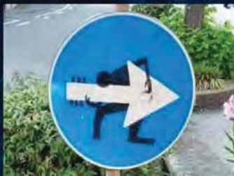
לא יודע מי עשה את זה אבל הרגת אותי