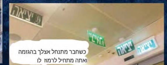
כשחבר מתנחל אצלך בהגזמה ואתה מתחיל לרמוז לו