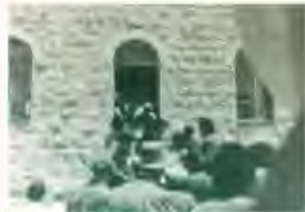
מירון תש"כ - אדמו"ר מבאיאן זצ"ל ביציאה משיבת בני עקיבא