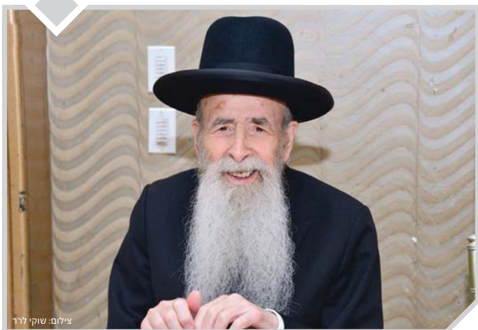
"את שבתתי תשמרו" (ויקרא כ"ה, ב')

הגאון רבי יהודה עדס שליט"א, והגאון רבי יצחק זילברשטיין שליט"א בעצות לשולחן השבת