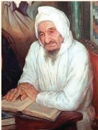
בעל המופת המקובל הא-לוקי סידנא בבא סאלי רבי ישראל אבוהצירא ז"ע"א בנו של הצדיק רבי מסעוד אבוהצירא שיום הלילא שלו יחול השבוע ביום שישי י"ב באייר

"בטוח הייתי כי ישועה לא תאחר להגיע. כי דמעות היוצאות מלב קרוע ומורתח של יהודי בוקעות שערי שמים - - -