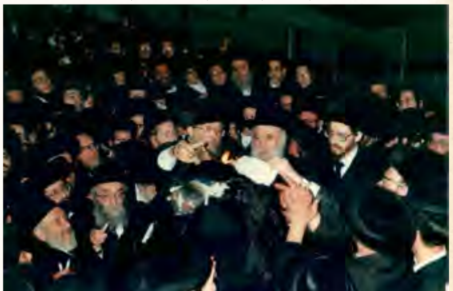
אדמו"ר שליט"א מבאיאן עם הגר"ש קפלן רבה של צפת בהדלקה, משמאל נראים הגה"ח זושא השל זצ"ל והגה"ח הגר"מ ברייאיר זצ"ל

יוחאי" אשר הכינו לכבודו כמה חדרים. בחצות הלילה עלה הרבי זי"ע על גג הציון והדליק את ההדלקה שעל ציון הרשב"י זי"ע. בעלות להב ההדלקה עלו והתגברו השירה, הזמרה וההיקודים לכבוד התנא האלוקי.