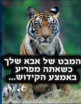
המבט של אבא שלך כשאתה מפריע באמצע הקידוש...

אין דבר מבאס יותר מלשלוח לבוס שלך הודעה שאתה מאחר ואז להגיע למשרד ולגלות שהוא לא בא היום וסתם הלשנת על עצמך בהתנדבות