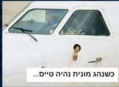
כשנהג מונית נהיה טייס...