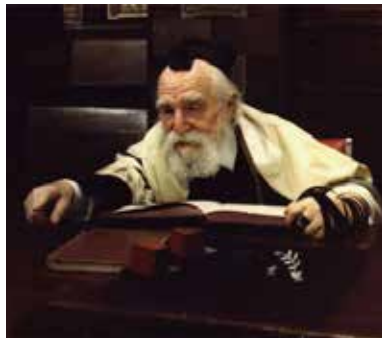
רבי משה פיינשטיין

שניהם דעו שהם לומדים עכשו עוד צד בגאונות של רבי משה. גאונות שבחסד. חסד שאינו מחפה להפכת תודה, שמצטנע ונחבא אל הכלים. חסד שכלו הטבה.