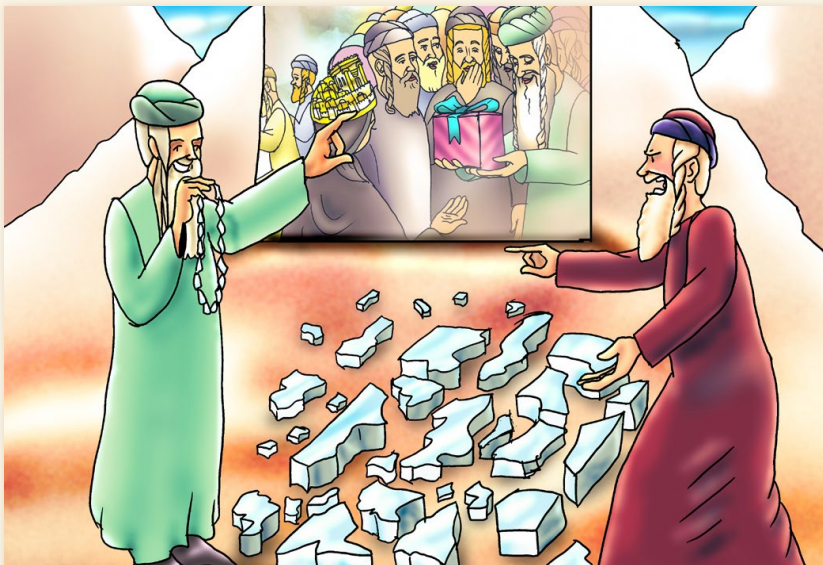
איזו כפירה זמן הקב"ה לעם ישראל כתיקון לחטא העגל? על כך במאמר: 'מתיקות הכפירה לישראל'!

לאחר חטא העגל משה רבנו שבר את הלוחות ועל פן הוצרך לעשות לוחות שניים שעליהם הקב"ה אמר לו "פסל לך", ודרשו חז"ל 'הפסלת תהיה שלך', ומהפסלת עשה שרשרת לכבד בה את צפורה אשתו (בשם בעל הבן איש חי), ועל כך פסע ורטן קרח והעמיד פנים שכביכול זהו זלוול בלוחות לעשות מהפסלת שלהם שרשרת לאשה.