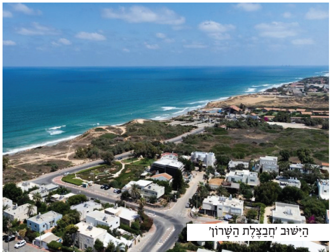
הישוב 'חבצלת השרון'

"כבוד הרב, אם תצליח לגרם לי לקבל את אותם ארבעה מיליון, אני מבטיחה להעניק לך מעשר מהסכום, כלומר: ארבע מאות אלף שקלים, לא פחות. מצדי תעשה עם הכסף ככל שתחפץ, קח אותו לעצמך, או חלק אותו לעניים ונצרכים, רק תמנע ממנו קדיש אחד..."