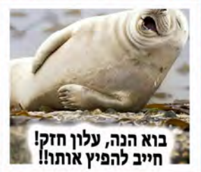
בוא הנה, עלון חזק! חייב להפיץ אותו!

ליטאי:נו...אז הצבעת בסוף ג'? ספרדי:האמת שניסיתי להכניס את הפתק ו... ליטאי:נו...ומה קרה? ספרדי:איך אומרים בסמינרים... "ולא היה מקום"