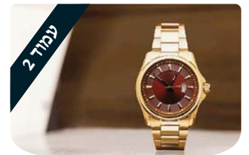
עמוד 2 הרב דוד ברוורמן להרגיש