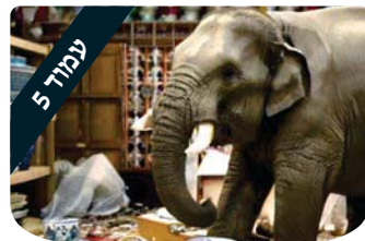
עמוד 5 כיצד להעיר בצורה מועילה? הרב מיכאל לסרי