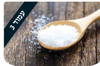
עמוד 3 מה הטעם? הרב משה לנדאו