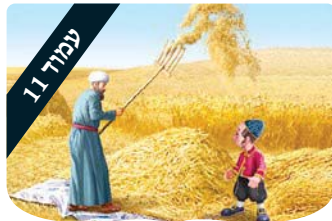
עמוד 11 מציא את ההבדלים ערכים לילדים

אפילו התבוננות קפדנית ביותר לא הייתה מגלה אף רמז להבדל הצפוי ביניהם.