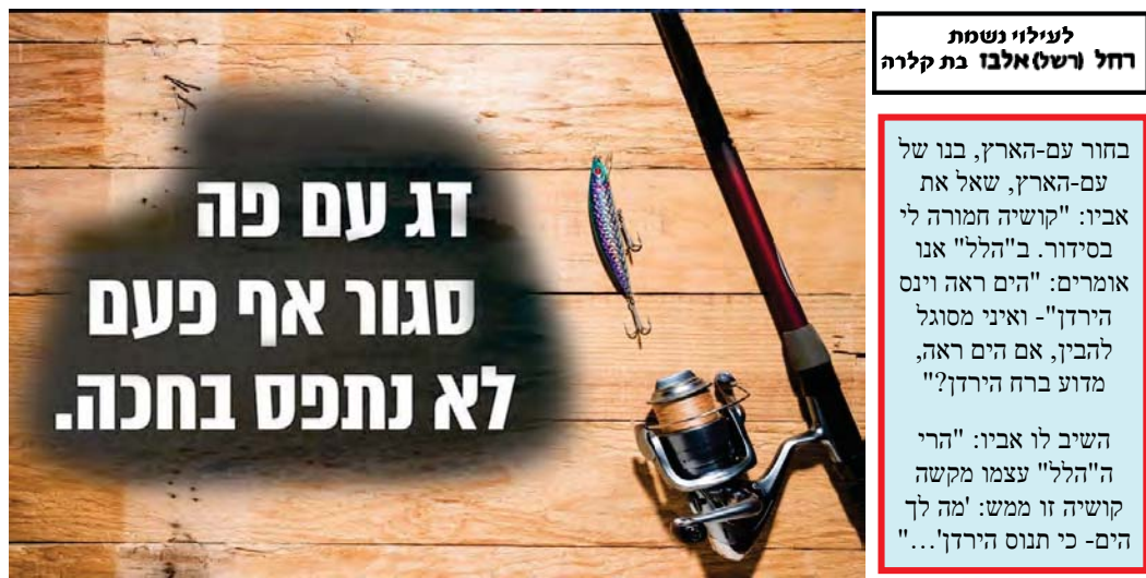
לעילוי נשמת רחל ורשאלבו בת קלרה

פעם נקלע הגאון רבי בן ציון אבא שאול זצ"ל לבית כנסת וחיפש את קופת הצדקה של בית הכנסת והכניס לתוכה שטר הגון . רק אז נטל ידיו והתחיל בתפילה. כשיצאו מבית הכנסת שאל את מלוויו: "היודעים אתם איזו מצוה קימתי בנתינת כסף לקופת בית הכנסת?" שאל וענה: "בקשתי לקיים מצות חינוך, כשבאים לבית הכנסת ונהנים מהמקום, מהשולחנות הערוכים, מאור החשמל וממיוזג האויר, כל זה עולה כסף, ויש להביע תודה . להשתתף במימון ולא לקבל מתנת חינם.."