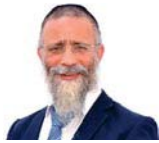
הרב מיכאל לסרי